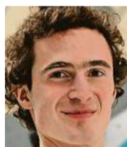
Adam Ondra lezec, brněnský sportovec roku

Přála bych si také, aby dnešní svět trochu zpomalil. Mám pocit, že všechno zbytečně kamsi chvátá a já tak trochu přestávám stíhat.