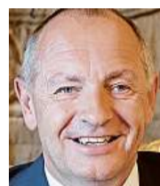
Libor Sečka velvyslanec České republiky ve Velké Británii

A aby žádnou z cest - ať po silnici, nebo železnici - zbytečně nebrzdily uzavírky, opravy, kolony, výluky a jiné komplikace. K tomu sice dvacát měsíců stačit nebude, ale přesto věřím, že zase o kus pokročíme dál tím správným směrem.