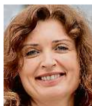
Monika Šimůnková zástupkyně veřejného ochránce práv

Přejí nám všem, abychom více naslouchali druhým a měli dost pochopení pro jejich názory. Věřím, že nás v novém roce čeká láska, optimismus a radost ze života.