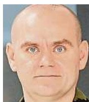
Miroslav Feix generál, šéf Velitelství ky- bernetických sil se sídlem v Brně

S tím souvisí i další přání - aby Brno přehodnotilo financování ohňostrojí. Myslím, že smyslem kultury je něco jiného. Přála bych si, aby Brno podporovalo spíše kulturu nepodbízející, aby mělo směle vize, ale i zodpovědnost za své kulturní instituce. Vždyť slovo „kultura“ znamená to, co je potřeba pěstovat! Kéž by rok 2020 byl plný smělejších a zodpovědnějších rozhodnutí.